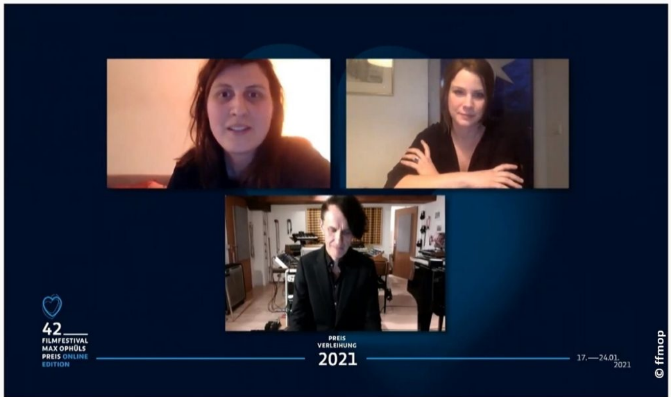
Dokumentarfilm-Jury des 42. FFMOP