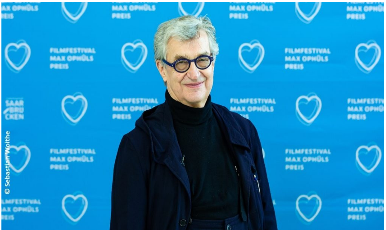
FFMOP Ehren-Preisträger Wim Wenders.