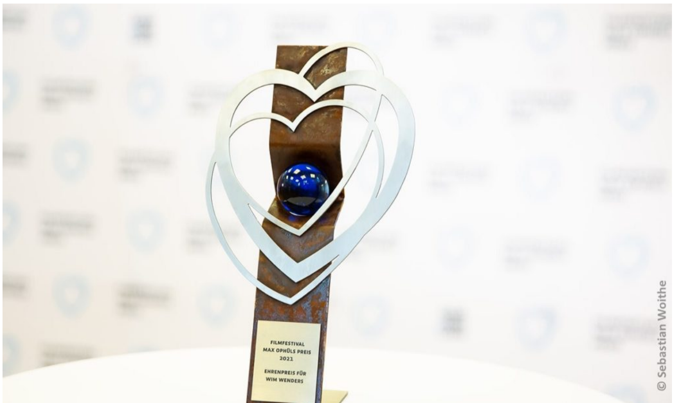
Trophäe des Ehrenpreises für Wim Wenders.

Zudem: Letztes Jahr widmete die ARD dem Filmemacher zum 75. Geburtstag eine Werkschau: „Wim Wenders, Desperado“ – als TV-Erstaussstrahlung am 14.08“ .