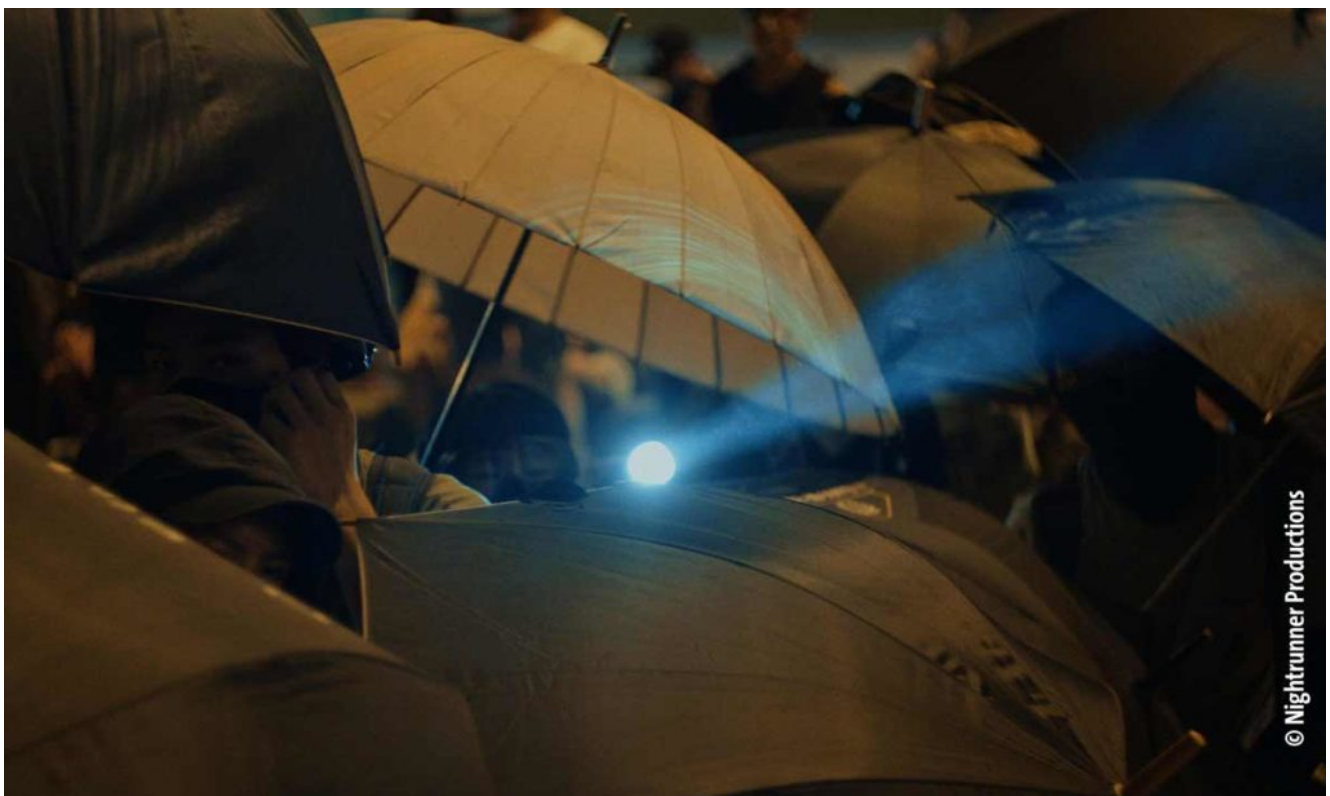
Proteste in Hongkong.