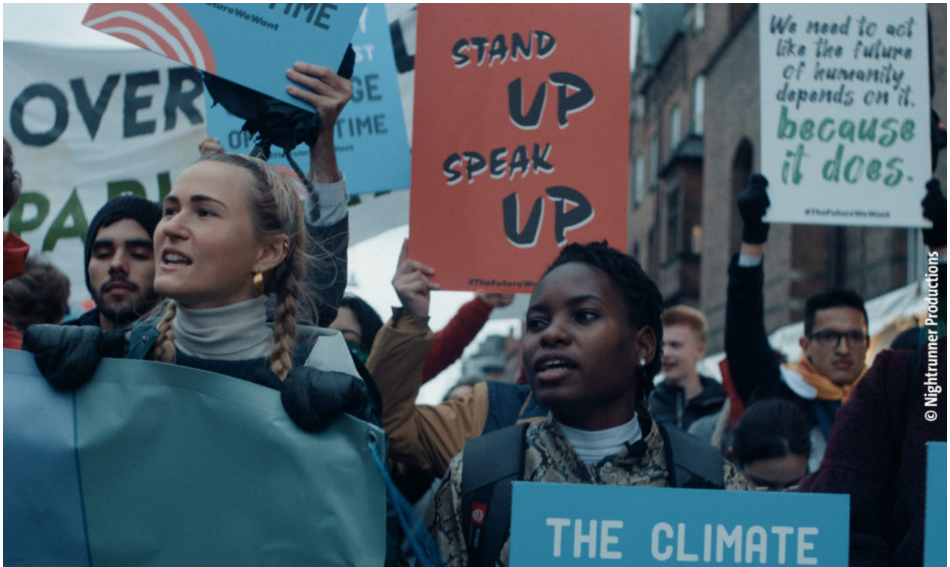
Protagonistin Hilda aus Uganda.