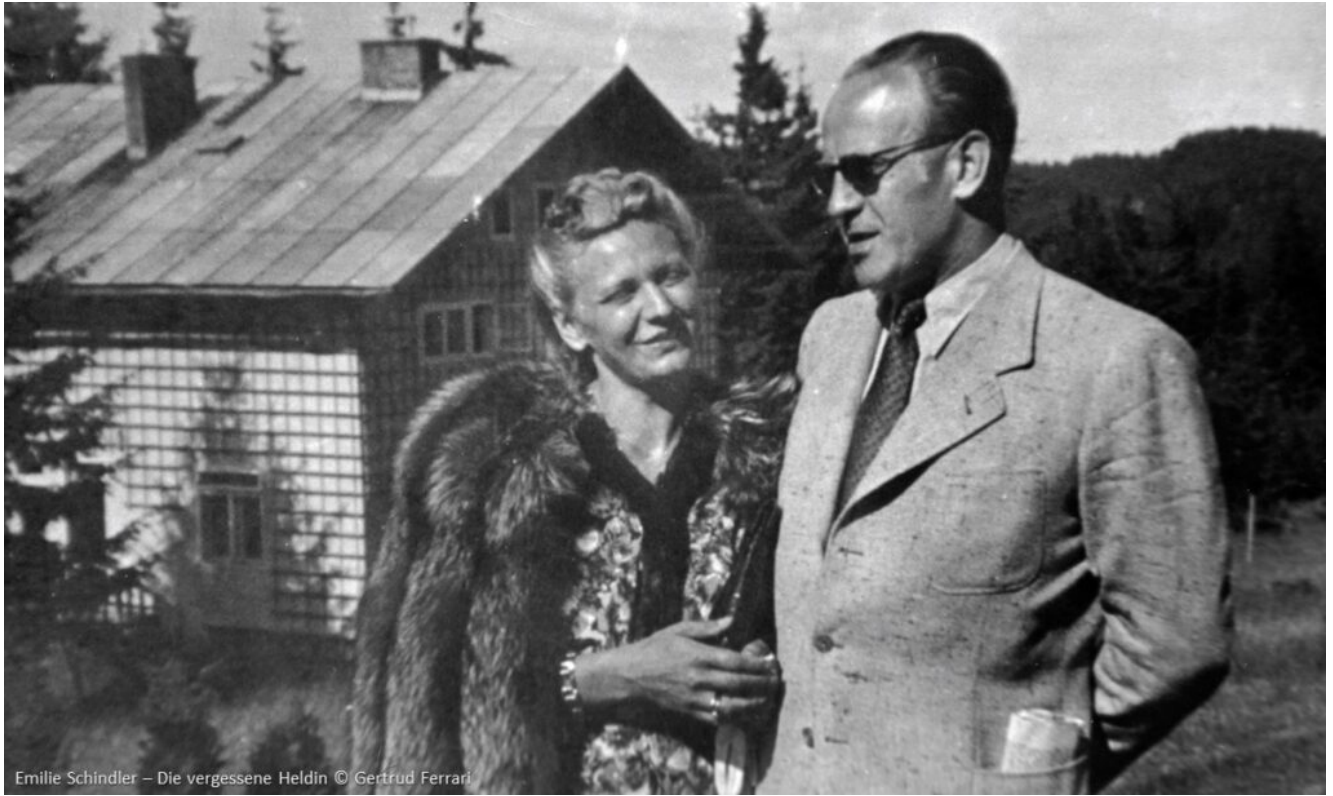
Emilie Schindler – Die vergessene Heldin