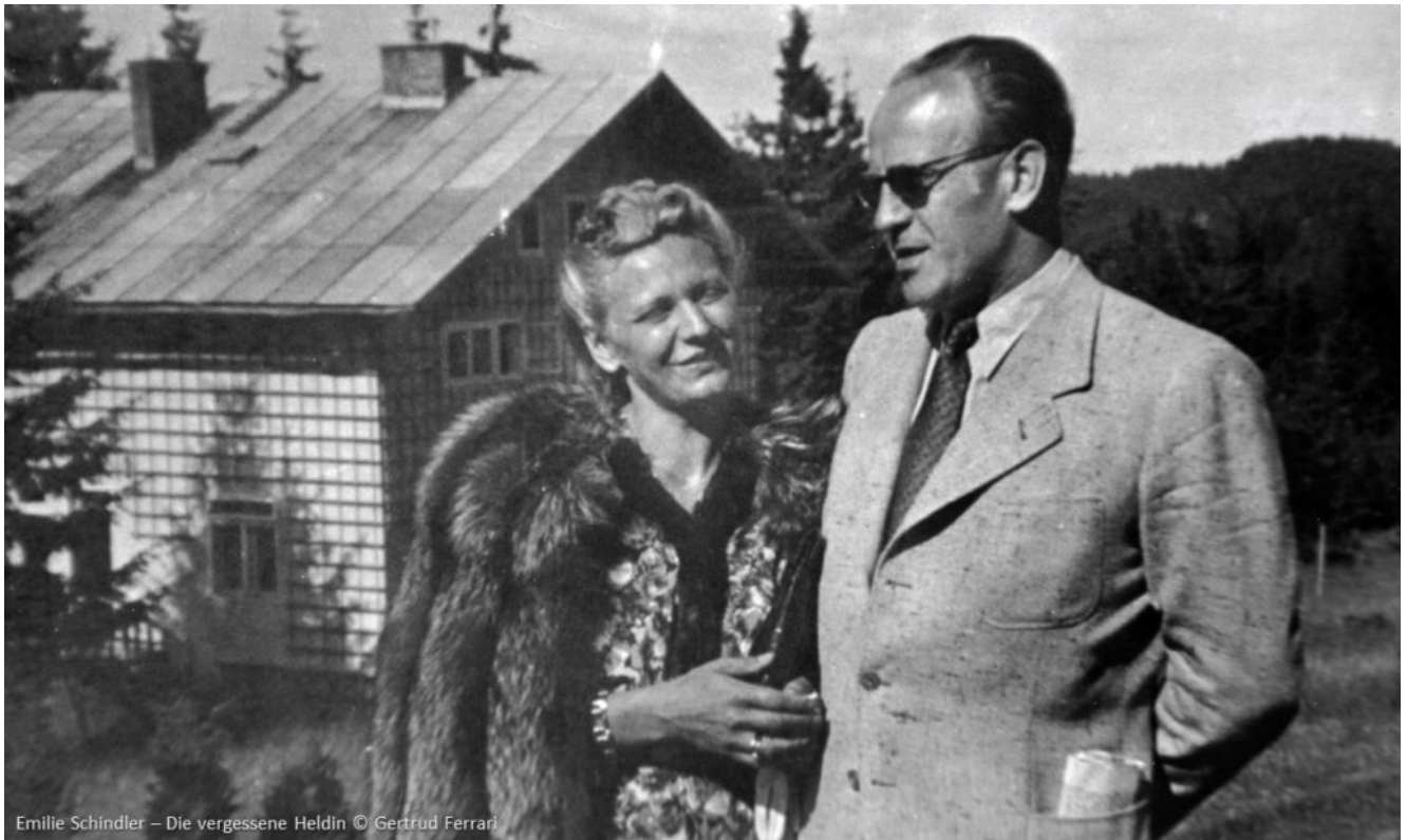
Emilie Schindler – Die vergessene Heldin