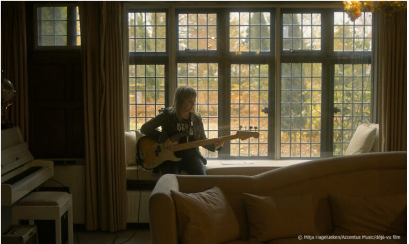
Bassistin Suzie Quatro