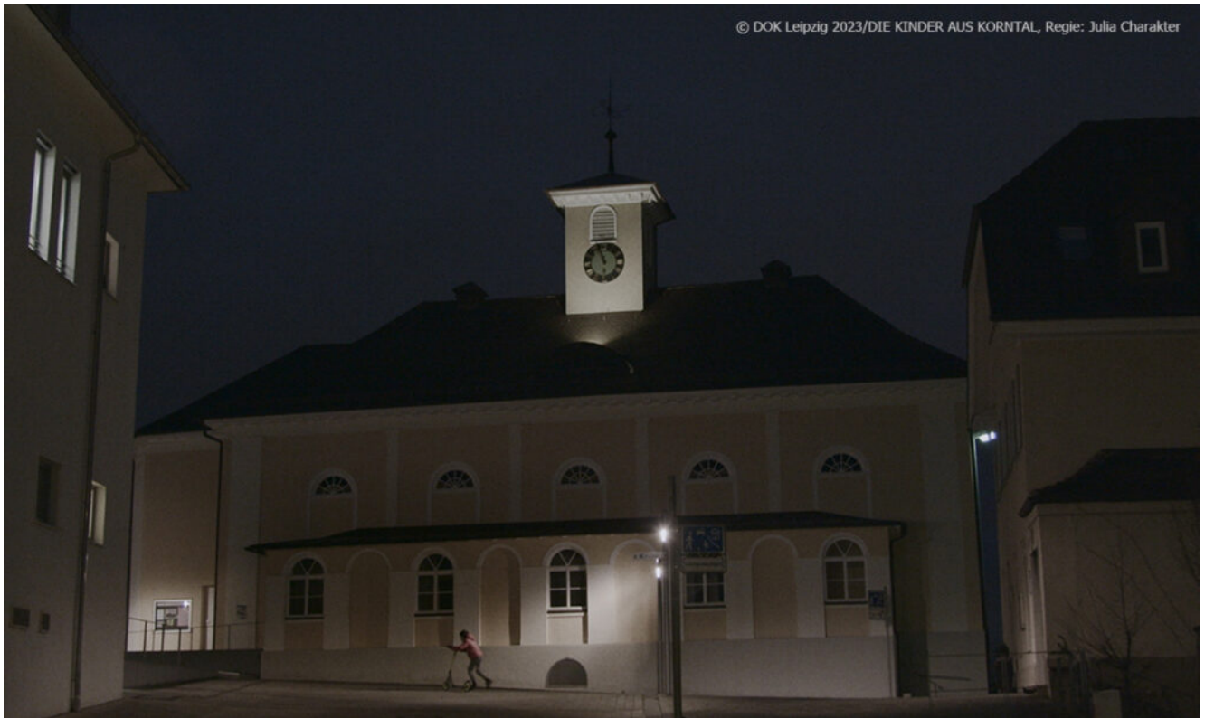
Blick auf den Saalplatz in Korntal (Filmstill aus DIE KINDER AUS KORNTAL)