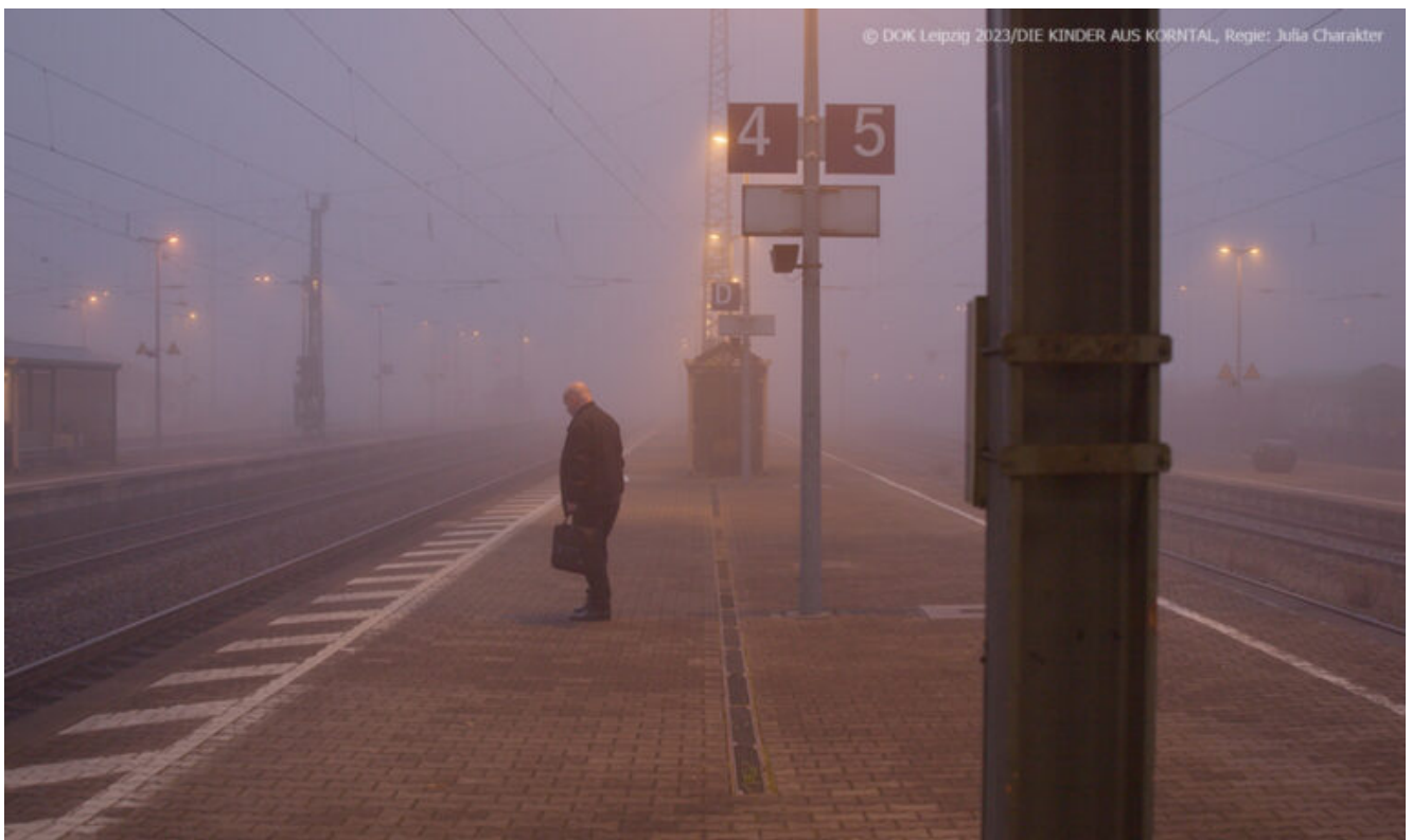
S-Bahnhof Korntal (Filmstill aus DIE KINDER AUS KORNTAL)