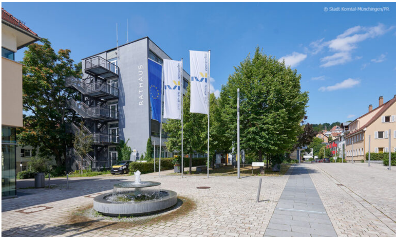
Rathaus Korntal-Münchingen

CONTENT WARNUNG: Dieser Artikel und der Dokumentarfilm DIE KINDER AUS KORNTAL behandeln Themen wie psychische, körperliche und sexualisierter Gewalt, PTBS, Suizidalität und Machtmissbrauch. Diese können Trigger sein und/oder (re)traumatisierend wirken. Hilfs- und Beratungsangebote sind u. a. beim BMFSFJ und bei Unicef gelistet.