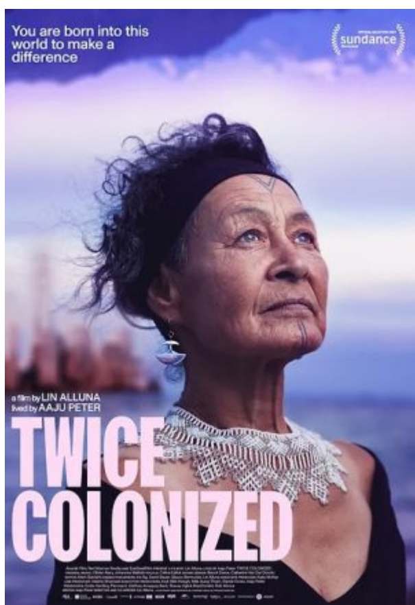
Plakat von TWICE COLONIZED

Das Kopenhagener Dokumentarfilmfestival CPH:DOX (15.-26.3.23) feiert seinen 20. Geburtstag. Angekündigt sind 200 aktuelle Produktionen etablierter Filmschaffender und von Newcomern, darunter über 100 Weltpremieren.