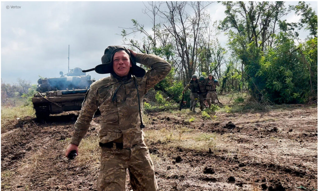
SHIDNIY FRONT (EASTERN FRONT)