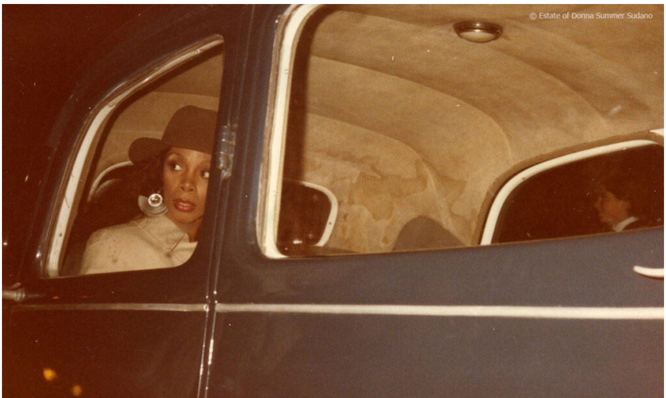
LOVE TO LOVE YOU, DONNA SUMMER