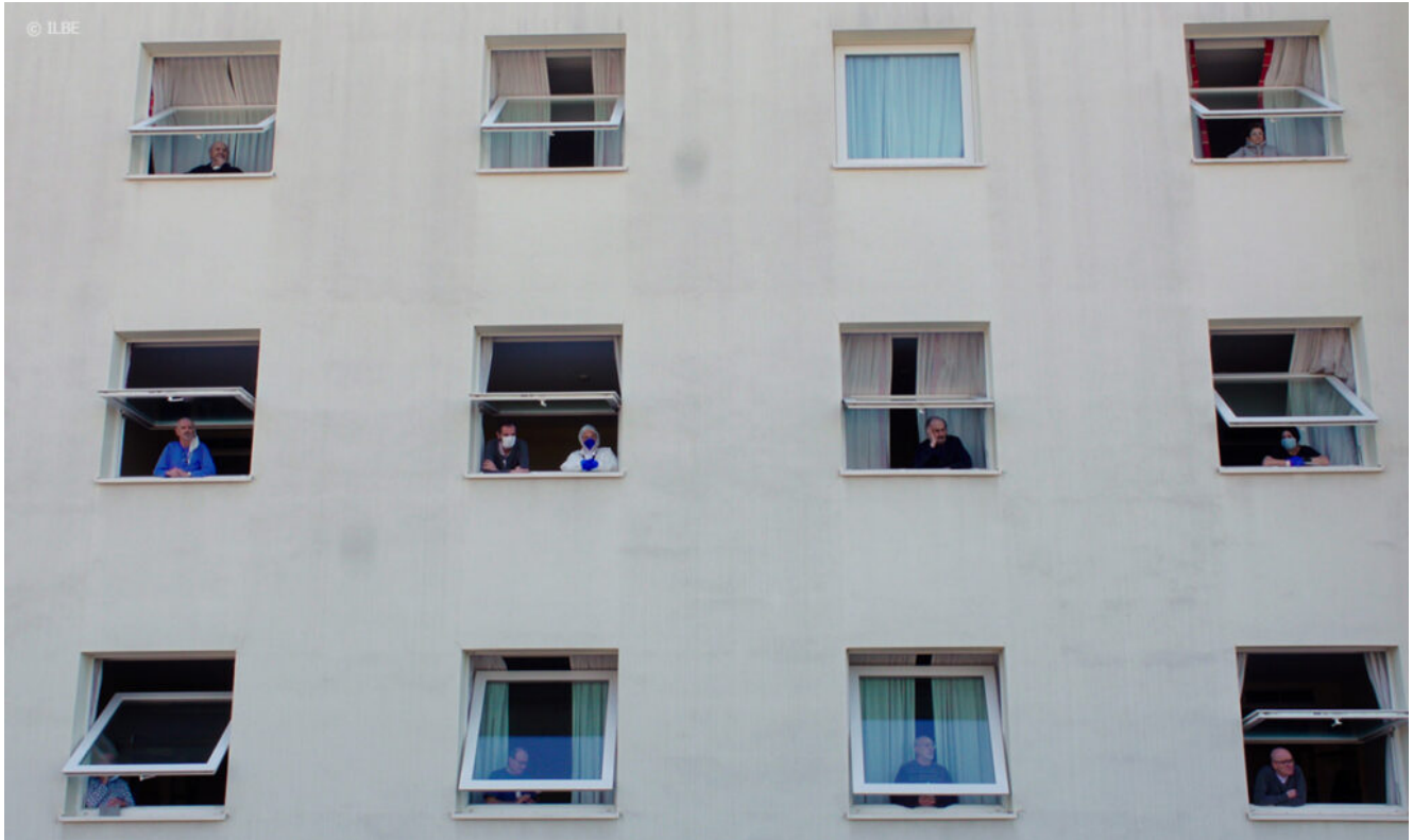
LE MURA DI BERGAMO (THE WALLS OF BERGAMO)

Estefanía „Beba“ Contreras (Generation) zeichnen ein Bild der Gegenwart. Die Einbürgerung im politisch gespaltenen Amerika stockt, Heimat ist kein verlässlicher Begriff. Ein Jahr begleitet STAMS von Bernhard Braunstein (Panorama) den Trainingsalltag der Ski-Elite im Internat Stams in den Tiroler Alpen. Es gilt als regelrechte Kaderschmiede.