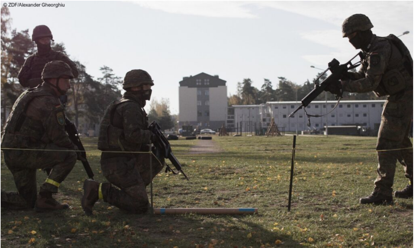
Häuserkampfübung auf dem NATO-Stützpunkt Rukla.