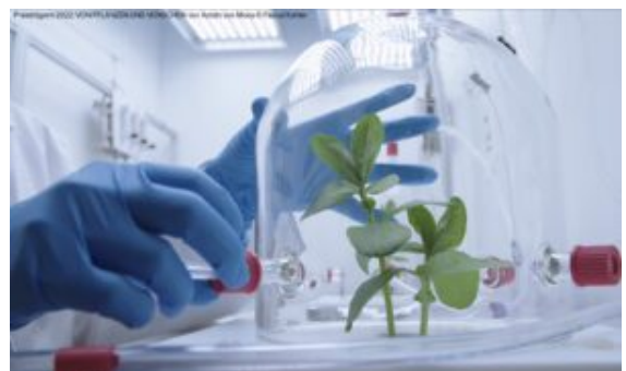
Filmstill "Von Pflanzen und Menschen" von Antshi von Moos