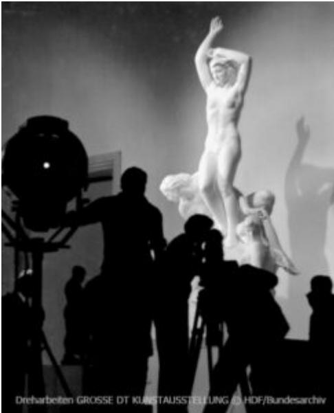
Dreharbeiten GROSSE DT KUNSTAUSSSTELLUNG 03

Selbst wenn im Nationalsozialismus die direkten Propagandafilme nur einen sehr kleinen Anteil der dokumentarischen Produktion ausmachten, so vermittelten die übrigen Kulturfilme oft unterschwellig die NS-Ideologie und ließen sich von den neuen Machthabern vereinnahmen. „Verglichen mit der reaktionären völkischen Fraktion war Goebbels ein Modernisierer, dem es um die Optimierung der Propaganda durch die schnelle Weiterentwicklung moderner Medien ging.“ (S. 79) Zum Einsatz der Wochenschau im Zweiten Weltkrieg gab es durchaus unterschiedliche Vorstellungen zwischen Propagandaminister Goebbels und Adolf Hitler.