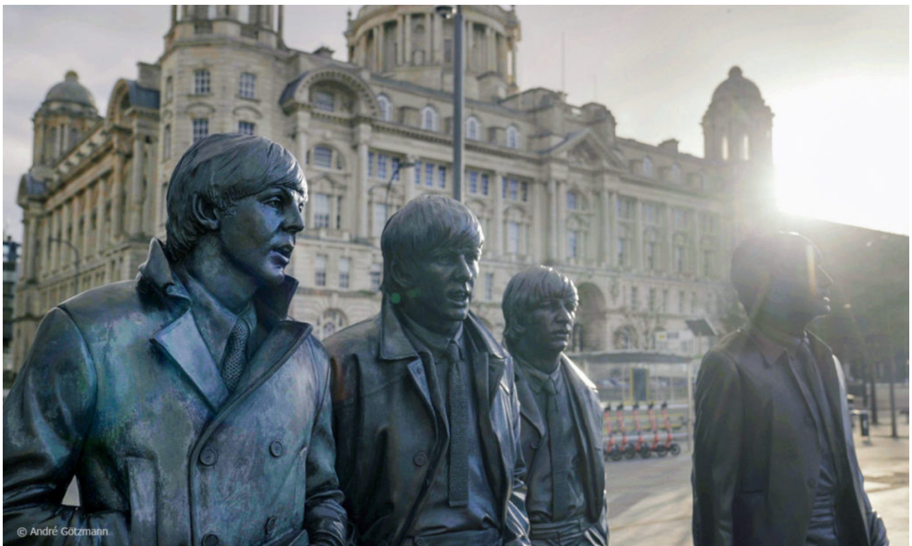
Allgegenwärtig: Denkmal der Beatles in Liverpool