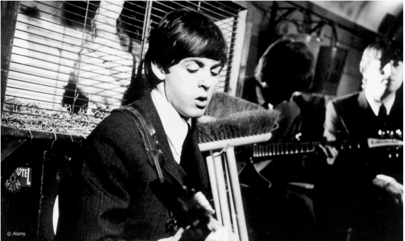
Mit 14 Jahren bekam Paul McCartney seine erste Gitarre