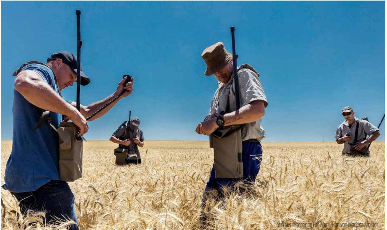
Still aus »Preparing for War«, Film von Marlene Moltor