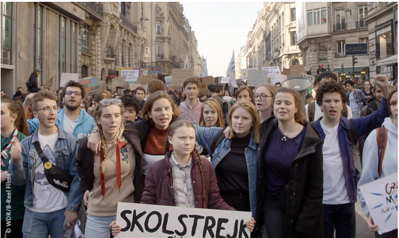
Deutscher Dokumentarfilmpreis 2021 für ICH BIN GRETA