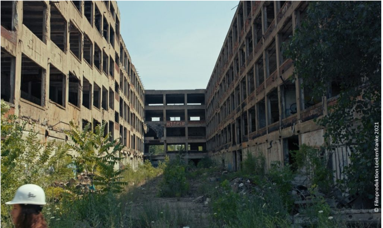
Filmstills aus Doku "We Are All Detroit", brache Flächen und ...