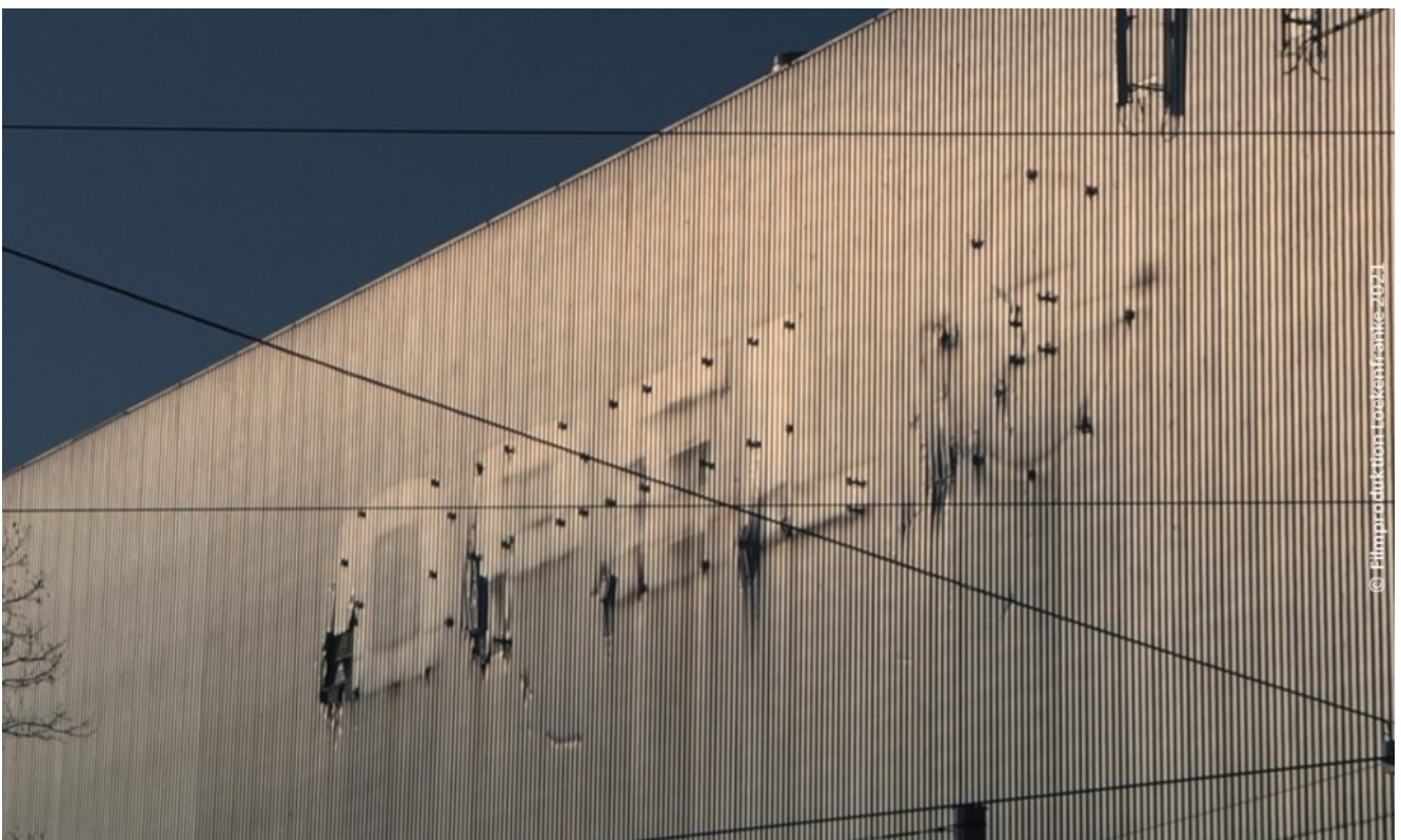
zerfallenes Opel Werk.