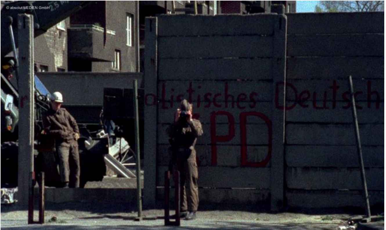
Die Mauer zwischen West- und Ostberlin