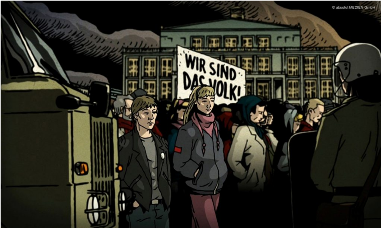
Animierte Szene aus "Die Mauer"