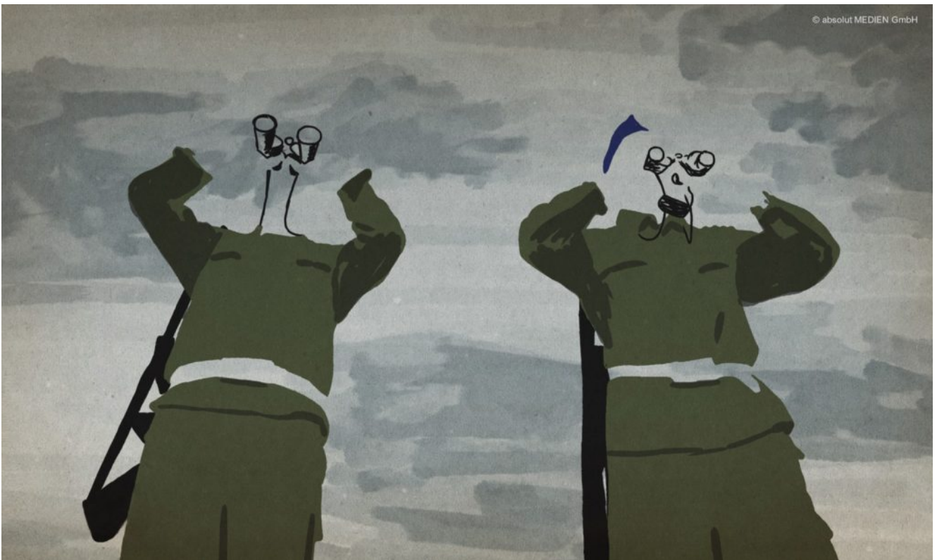
Animierte Szene aus "Die Mauer"