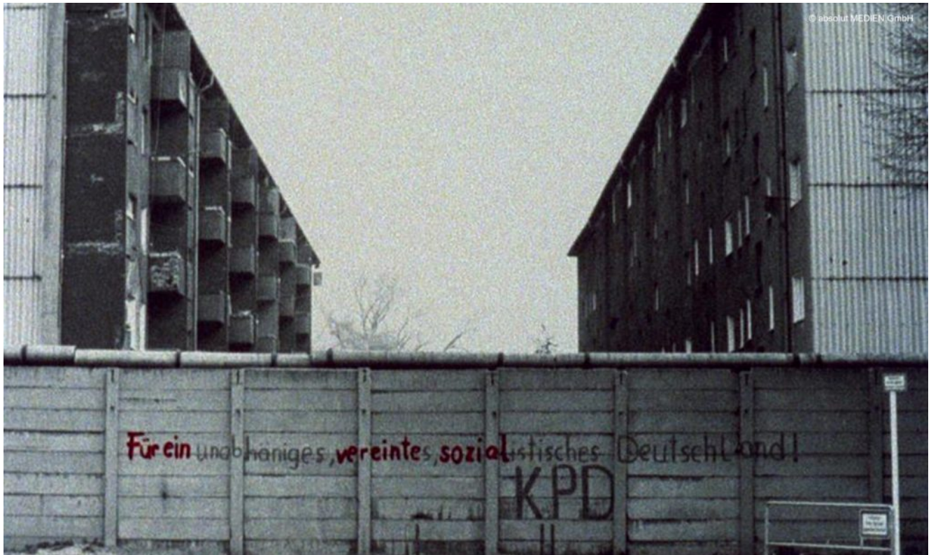
Die Mauer zwischen West- und Ostberlin