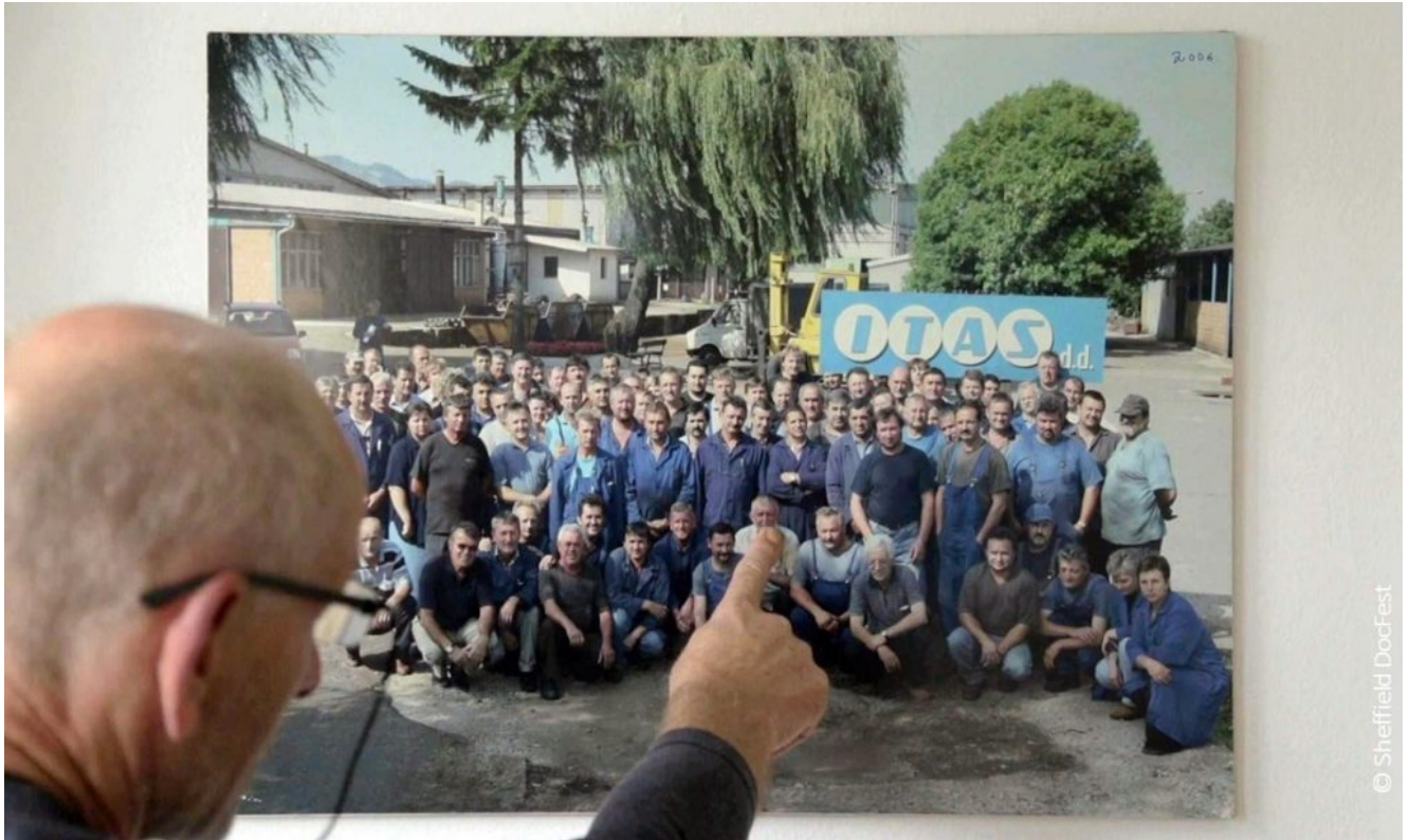
Filmstill aus "Factory of the Workers".