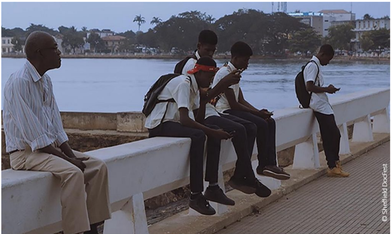
"Equatorial Constellation" – Doku über Biafra-Krieg 1967.